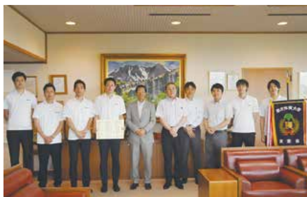
三連覇を市長に報告

この優勝を励みに我々は今後も武蔵野市の誇りを胸に戦い続けます。末筆となりましたが、ご支援、ご声援を賜りました多くの関係者の皆様にご場をお借りしてお礼申し上げます。