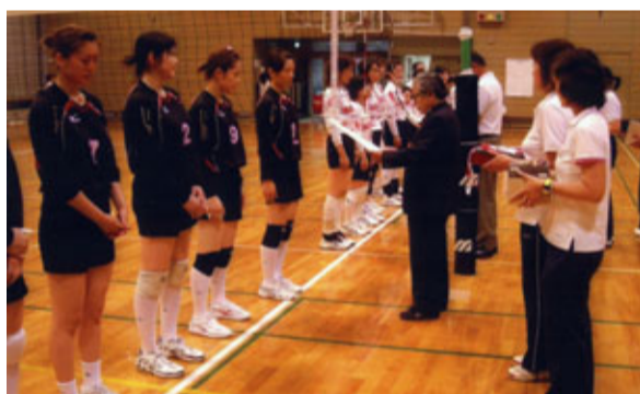
市町村総合体育大会(バレーボール競技)での表彰(女子)

今後とも、当連盟発展のため、一層のご理解とご支援を賜りますようお願い申し上げます。