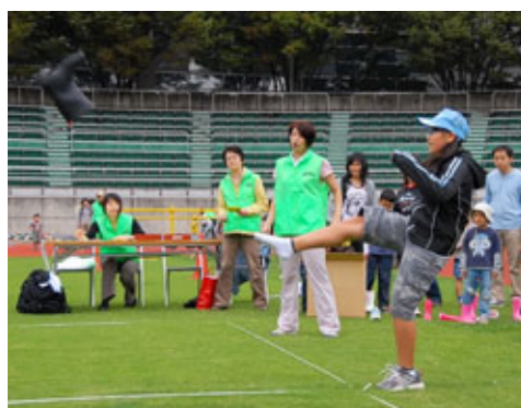
エーイ！ 長靴飛べー